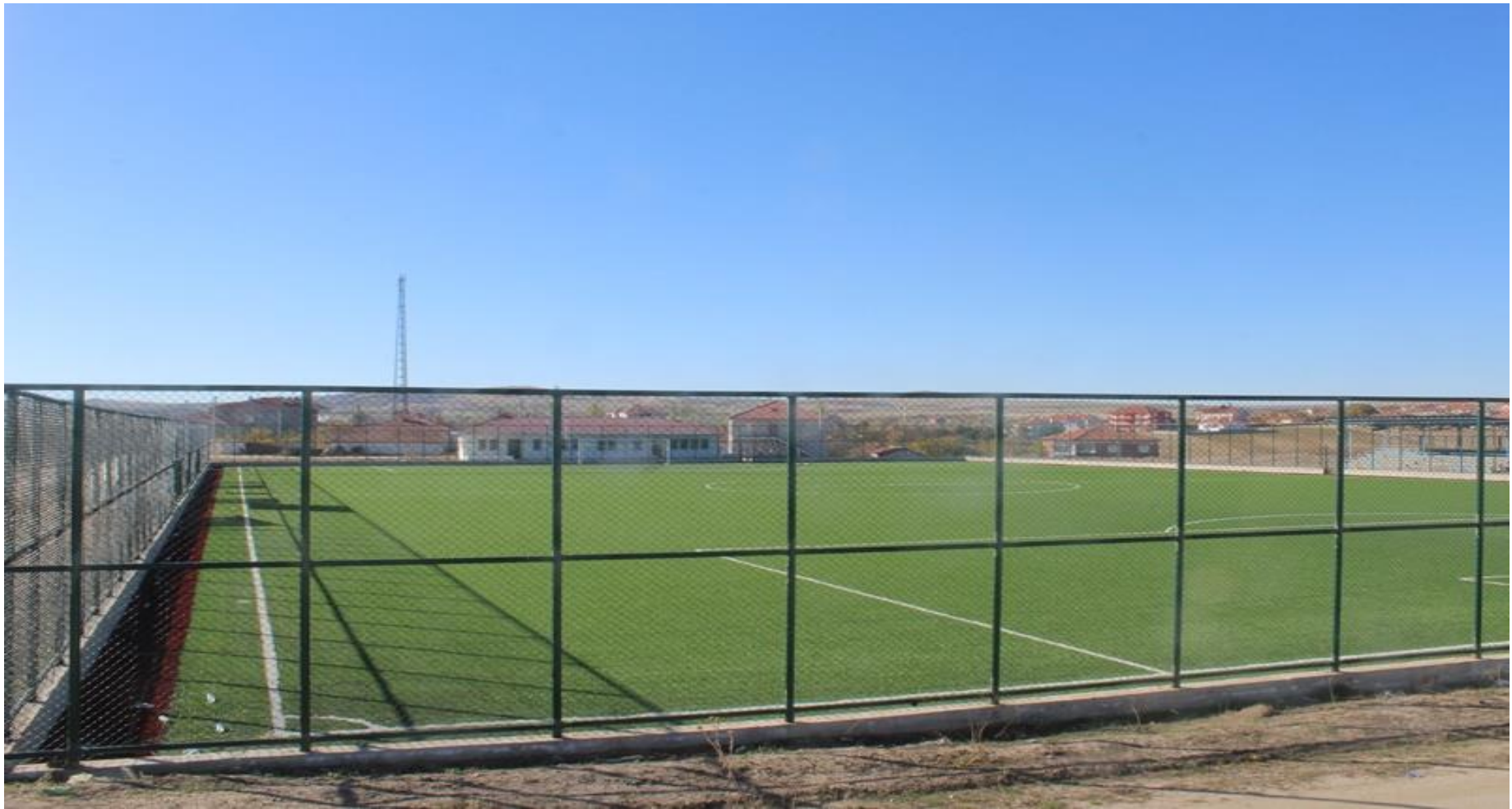
AĐAÇÖREN SENTETİK ÇİM FUTBOL SAHASI