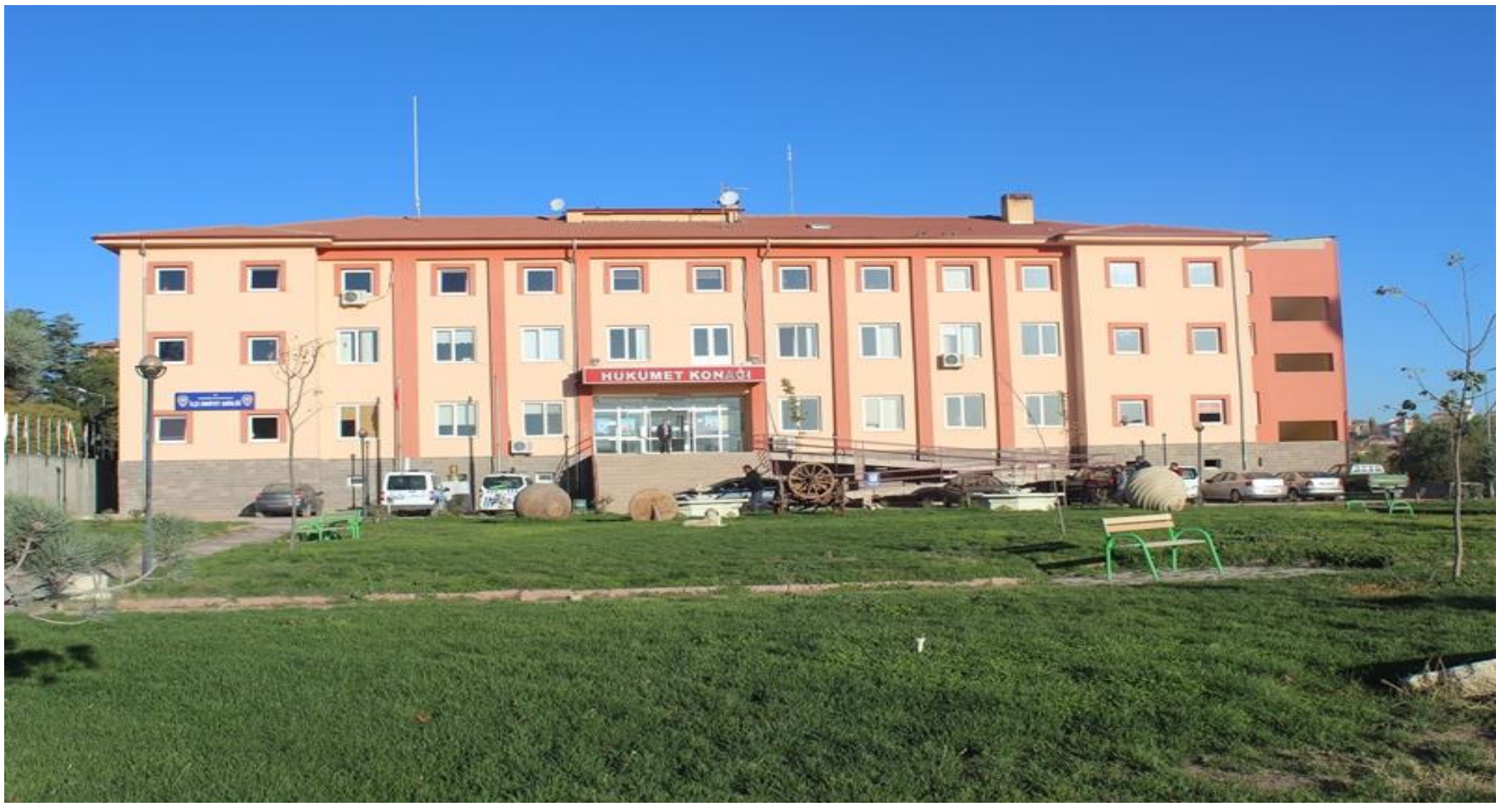
AĐAĐÖREN HÜKÜMET KONAĐI