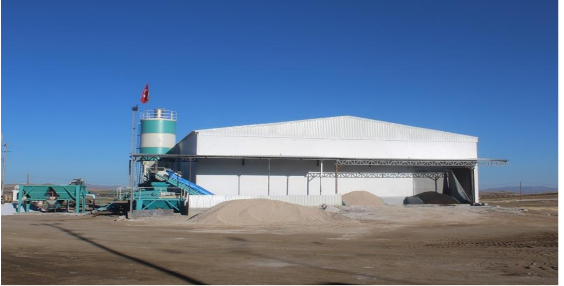
AĞAÇÖREN BİMS FABRİKASI