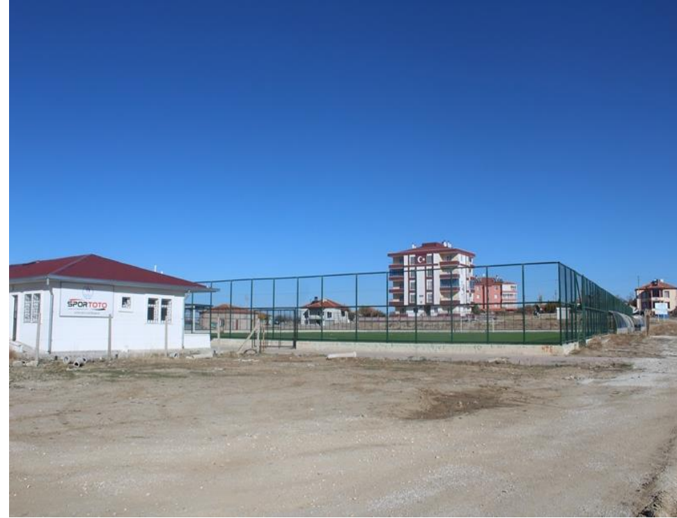
AĞAÇÖREN SPOR SAHASI