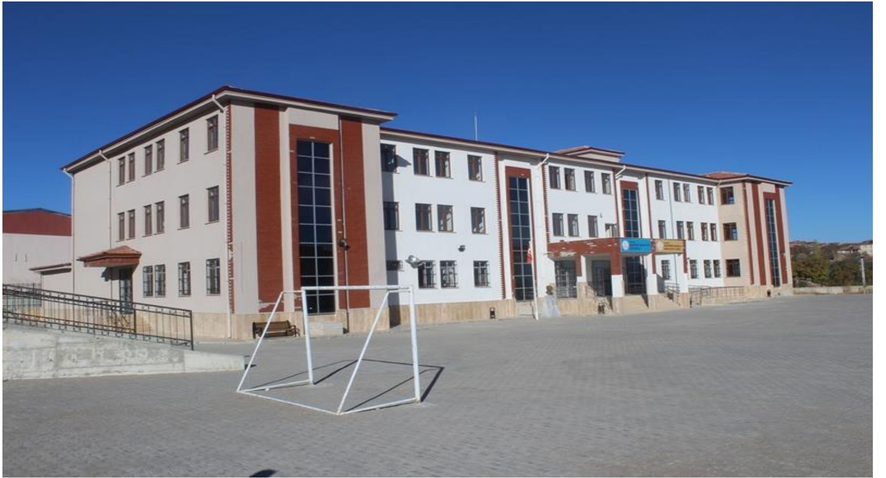
AĞAÇÖREN ANADOLU İMAM HATİP LİSESİ-AĞAÇÖREN İMAM HATİP ORTAOKULU