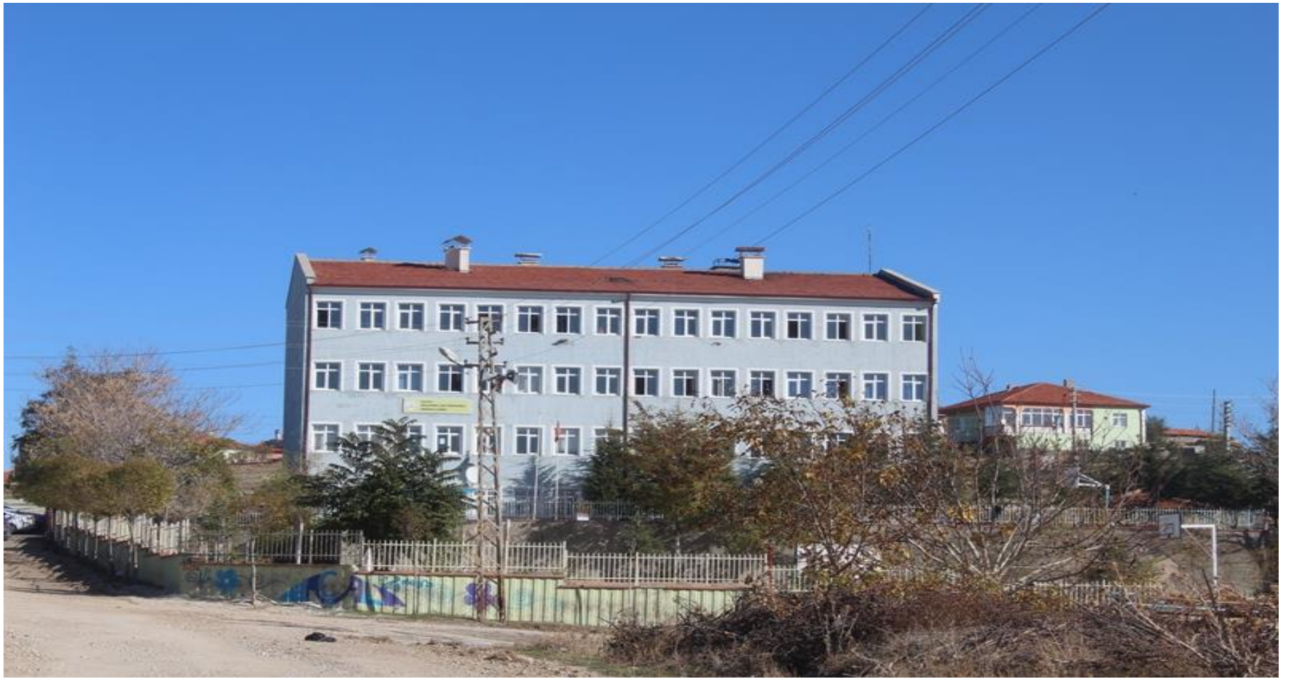
AĐAÇÖREN ÇOK PROGRAMLI ANADOLU LİSESİ