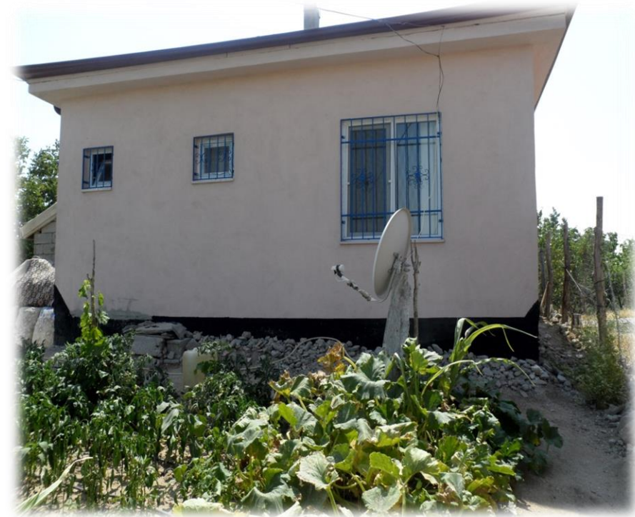
AĞAÇÖREN SYDV TARAFINDAN YAPILAN EV