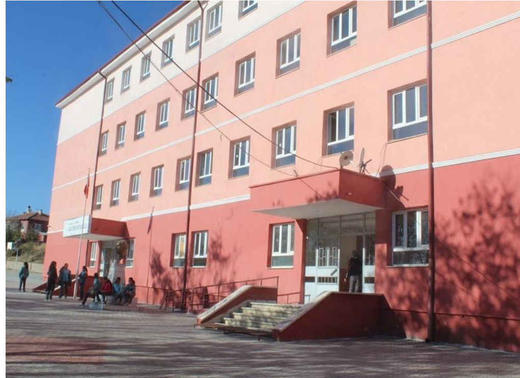
AĞAÇÖREN ATATÜRK ORTAOKULU