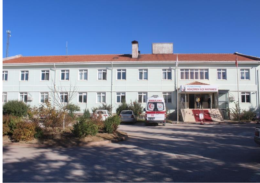
AĞAÇÖREN DEVLET HASTANESİ